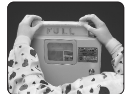
Figura 2 Círrrelo conforme a las instrucciones (R98334H).

SI NECESITA ASISTENCIA O DESEA ORDENAR COMPONENTES DE REEMPLAZO, LLAME AL 800.772.5657