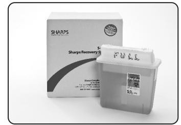
5-Quart Sharps Recovery System

Go to www.sharpsinc.com for more information.