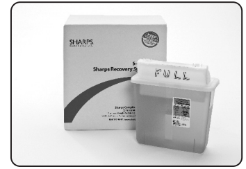
Sistema de Recuperación de 5 cuartos de galón

Para obtener más información, vaya a www.sharpsinc.com .