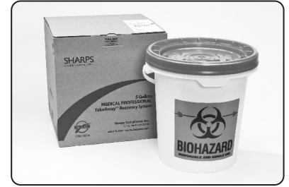
Sistema de recolección profesional TakeAway para fines médicos, de 5 galones.

Visite www.sharpsinc.com si desea información adicional.